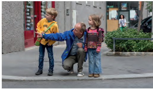
Regelmäßiges, gemeinsames Training ist wichtig!

Gehen Sie mit Ihrem Kind den Schulweg ab und erklären Sie ihm, warum es wo gefährlich ist und worauf es als Fußgängerin bzw. Fußgänger achten muss. Üben Sie problematische Stellen (siehe Schulwegplan) besonders gut! Beim nächsten Mal lassen Sie sich bereits von Ihrem Kind führen, das dabei über sein Verhalten spricht. So können Sie feststellen, ob es alles richtig verstanden hat und eventuell korrigierend eingreifen.