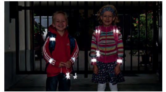
Sicherheit durch Sichtbarkeit!

Sorgen Sie dafür, dass Ihr Kind im Straßenverkehr rechtzeitig gesehen wird! Gerade im Herbst und Winter, wenn es in der Früh noch dunkel ist oder bei nebligem Wetter ist helle Kleidung von Vorteil. Noch besser wirken Reflektoren an Kleidung und Schultaschen – mit diesen können Kinder von Fahrzeuglenkerinnen und Fahrzeuglenkern schon aus einer Entfernung von 130 Metern wahrgenommen werden.